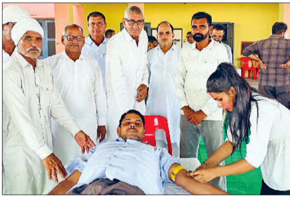
रतिया। अलालवास में रक्तदान करते युवा।