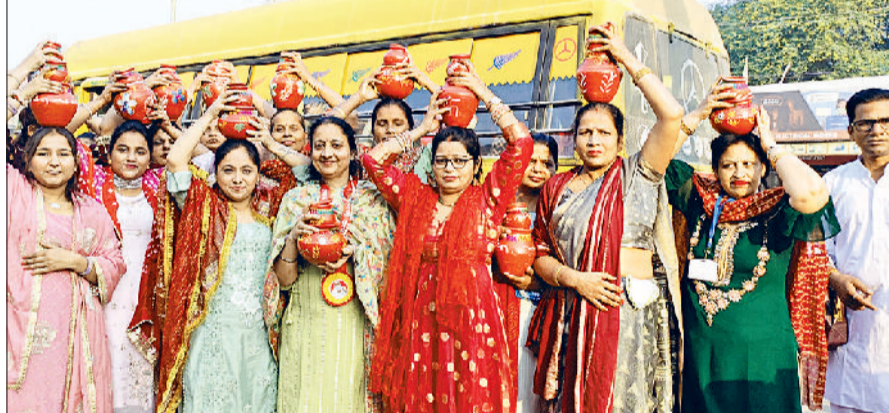
सिरसा। शहर में कलश यात्रा निकालती हुए महिलाएं।