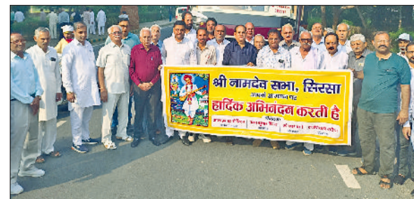
नामदेव जयंती समारोह के लिए सिरसा से जत्था रवाना होते हुए।