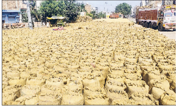
फतेहाबाद। अनाज मण्डी में धान से भरी बोरीयं।

जिले की मण्डियों और खरीद केंद्रों पर धान की आवक जोरों पर है। इस बार धान की खरीद ने पिछले साल की खरीद का रिकॉर्ड तोड़ दिया है। अब तक जिले में पिछले साल से 1 लाख 30 हजार एमटी ज्यादा धान की आवक हो चुकी है। जिले में तीन खरीद एजेंसियां फूड एंड सप्लाय डिपार्टमेंट, हैफेड और हरियाणा वेयर हाउसिंग कॉर्पोरेशन एमएसपी पर धान की खरीद कर रही है। जिले में अब तक 8 लाख 73 हजार 346 एमटी धान की आवक हो चुकी है, जिसमें से 8 लाख 52 हजार 768 एमटी धान की खरीद की जा चुकी है। इसमें से करीब 73.33 प्रतिशत यानि 6 लाख 40 हजार 4141 एमटी धान की लिफ्टिंग हो चुकी है जबकि 2 लाख 12 हजार 354 एमटी धान अब भी मण्डियों व खरीद केंद्रों पर पड़ा है। जिले में पिछले साल कुल 7 लाख 43 हजार 194 एमटी धान की खरीद की गई थी। बता दें कि सरकार द्वारा ग्रेड ए धान का