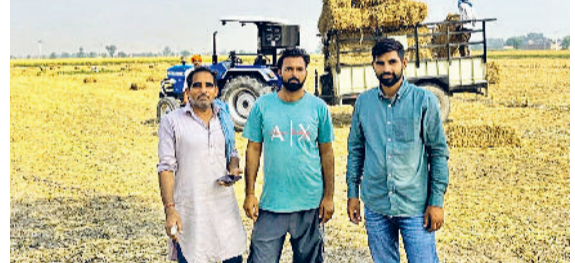
सिरसा। किसानों को पराली बनाने के बारे में जागरूक करते हुए।