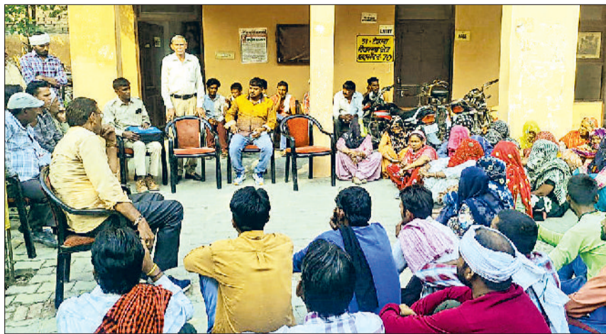
फतेहाबाद। महापुकार रैली को लेकर जनसम्पर्क अभियान चलाते कर्मचारी नेता।