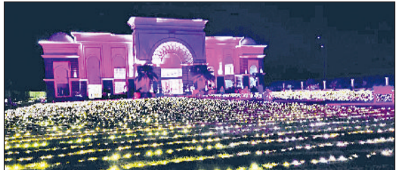
फतेहाबाद। शहर का सजा हुआ मैरिज पैलेस व बारात रवानगी के लिए तैयार खड़ी गाड़ी।

भगवान विष्णु अपनी चार महीने की योग-निद्रा से जागते हैं। इसी के साथ सृष्टि का संचालन फिर से शुरू हो जाती है और पिछले चार महीनों से बंद हुए सभी मांगलिक काम फिर से शुरू हो जाते हैं। जिनमें शादी, मुंडन, गृह प्रवेश और यज्ञोपवीत संस्कार आदि प्रमुख हैं। इस साल देव उठनी एकादशी 1 नवंबर को मनाई जाएगी, जिसके बाद शादी की शहनाई भी बजने लगेंगी। इन दिनों शहर में हल्की गुलाबी ठंड का आगाज हो गया। शहर के मैरिज पैलेसों, होटलों व धर्मशालाओं में रौनक सा माहौल दिखाई देने लगा है। एक अनुमान के अनुसार शनिवार 1 नवंबर को जिलेभर में 200 से अधिक जोड़े विवाह के परिणय सूत्र में बंधेंगे।