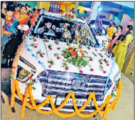
फतेहाबाद। शहर का सजा हुआ मैरिज पैलेस व बारात रवानगी के लिए तैयार खड़ी गाड़ी।

शास्त्रों के अनुसार भगवान विष्णु चार मास के लिए विश्राम करते हैं, जलुआई को भगवान विष्णु नौद में गाए थे, जिसे देवशयनी के नाम से जाना जाता है। 25