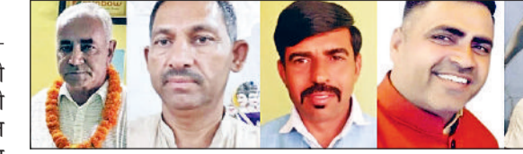
भूना। मार्केट कमेटी के मनोनीत सदस्य।