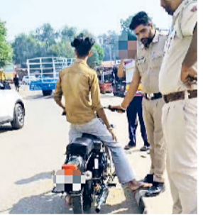
सिरसा। यातायात पुलिस बुलेट चालक का चालान काटते हुए।